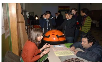
Stand de información de la OR.C.A. en una fiesta boliviana

El objetivo de esas sesiones de información era informar a la gente con respecto a sus derechos en el trabajo, independientemente de su estatuto de residencia. Hemos intentado lograr este objetivo de manera interactiva; haciendo reflexionar a la gente acerca de su situación de trabajo.